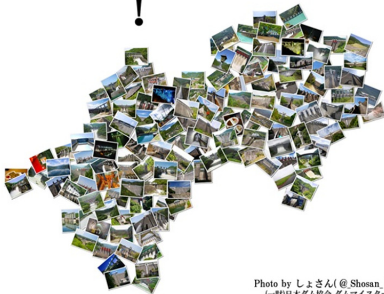
Photo by しょさん (@_Shosan_) (一財)日本ダム協会 ダムマイスター ※写真の位置は実際のダム所在地ではありません