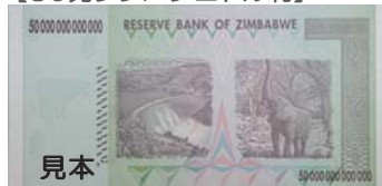
(カリバダム：ジンバブエ共和国)