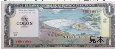
(セロングランデダム ：エルサルバドル共和国)