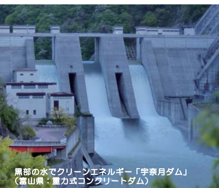
黒部の水でクリーンエネルギー「宇奈月ダム」 (富山県：重力式コンクリートダム)