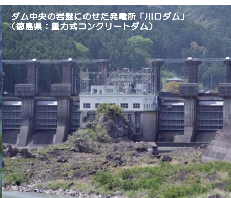
ダム中央の岩盤にのせた発電所「川口ダム」 (徳島県：重力式コンクリートダム)