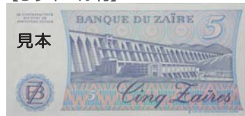
(インガIダム：ザイール共和国)