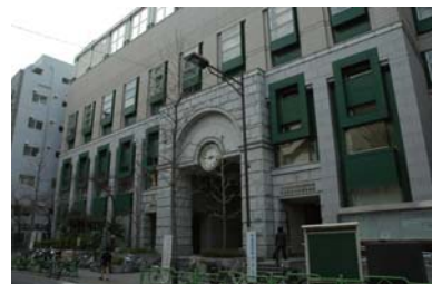
日本橋社会教育会館

軽食とソフトドリンクをご提供いたします。 職場の仲間、お友達、ご近所などお誘い合わせのうえ、 お気軽にお越し下さい。