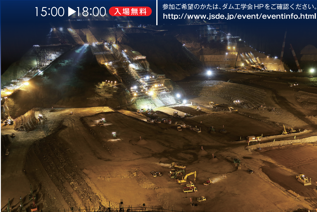
「未来を築く」 小石原川ダム (福岡県朝倉市) : 2018九州ダムフォトコンテスト最優秀賞

参加ご希望のかたは、ダム工学会HPをご確認ください。 http://www.jsde.jp/event/eventinfo.html