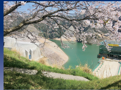
「桜とダム」 大分川ダム (大分県大分市)