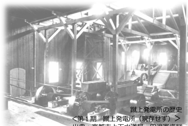
蹴上発電所の歴史 ＜第1期 蹴上発電所（現存せず）＞