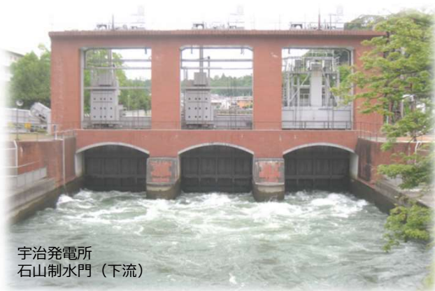
宇治発電所 石山制水門 (下流)