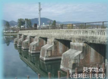
見学地点 (旧瀬田川洗堰)