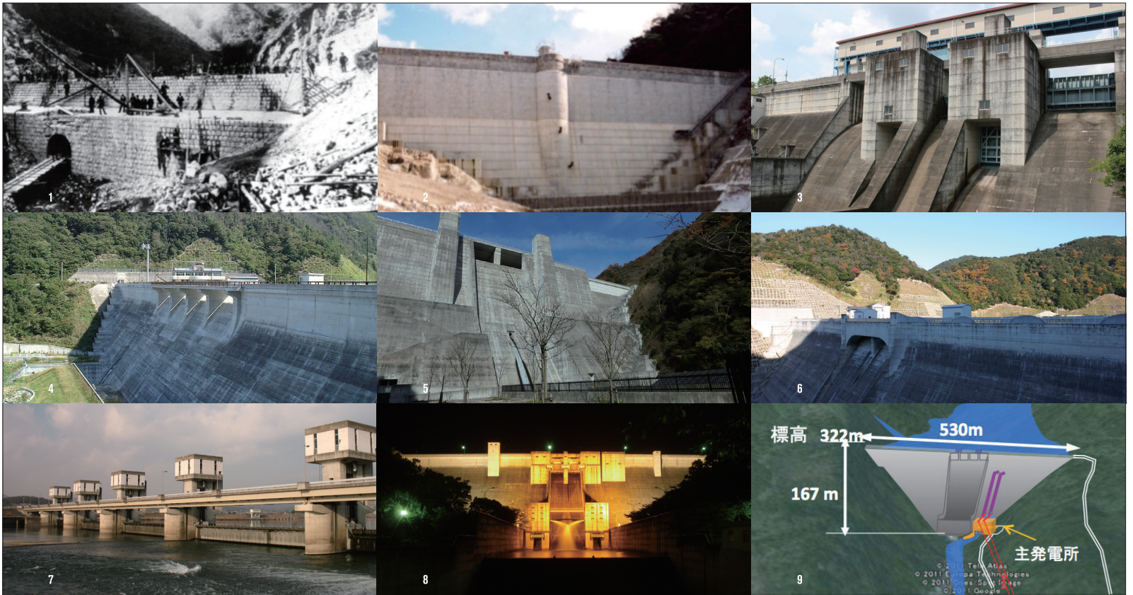
1.建設中の布引五本松ダム 2.耐震補強後の布引五本松ダム 3.青野ダム 4.大日ダム 5.石井ダム 6.成相ダム 7.加古川大堰 8.一庫ダム 9.ラオス ナムニアップ1水力プロジェクト